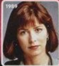
STYLING: JANE WOOD; GROOMING: JENNIFER CHAMBERS; HAIR: CARLOS SERRA; MAKEUP: TINA BUCHHEIM; PROP STYLING: JENNIFER BUCHHEIM; SET DESIGNER: JENNIFER BUCHHEIM

"I've been using a skin-care line called NuSkin for 20 years. It's like a pyramid thing, I'm a distributor, and I just distribute it to myself!"