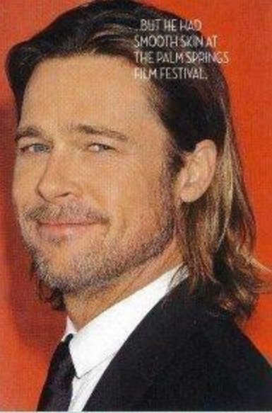
BUT HE HAD SMOOTH SKIN AT THE PALM SPRINGS FILM FESTIVAL.