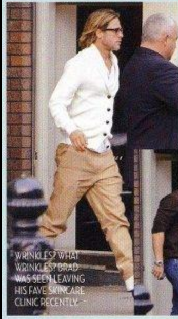
WRINKLES? WHAT WRINKLES? BRAD WAS SEEN LEAVING HIS FAVE SKINCARE CLINIC RECENTLY.

carpet recently with a greying beard, thick glasses and a cane. "Brad has aged quite a bit over the past few years, but at Palm Springs he looked fantastic," notes a source. "His skin was smooth and his complexion glowing."